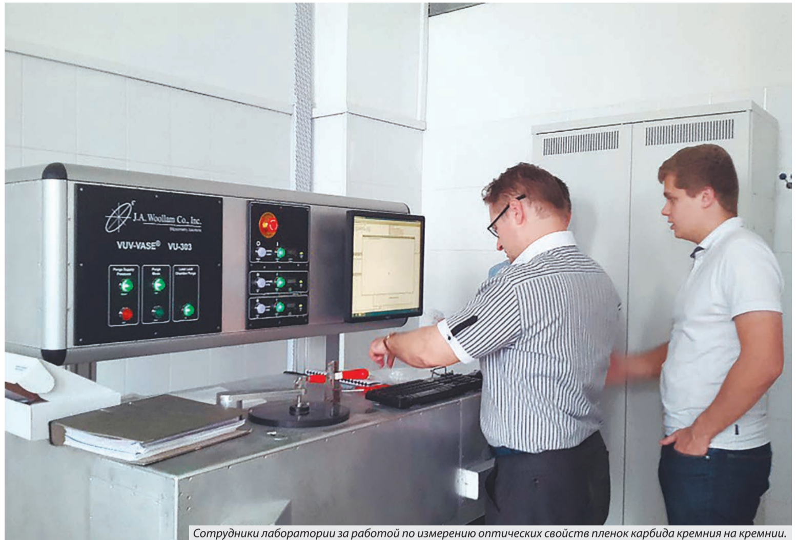
Сотрудники лаборатории за работой по измерению оптических свойств пленок карбида кремния на кремнии.

- Да, конечно. Молодежь у нас замечательная. Один из моих учеников получает стипендию Президента РФ для аспирантов, 75 тысяч рублей - это одна из самых престижных форм поддержки молодых ученых в России. Скоро защищает кандидатскую. Еще один сотрудник, 34 года, вот-вот выйдет на защиту докторской. Но вот что я хотел бы заметить, пользу-