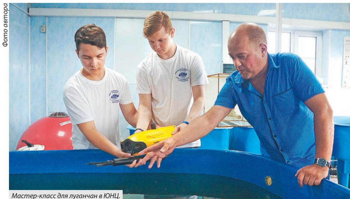
Мастер-класс для луганчан в ЮНЦ.