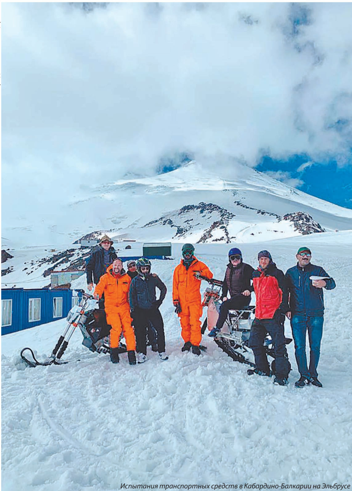
Испытания транспортных средств в Кабардино-Балкарии на Эльбурсе