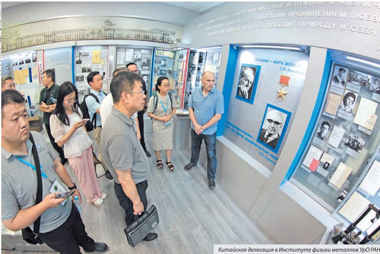
Китайская делегация в Институте физики металлов УрО РАН