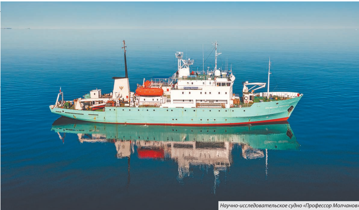
Научно-исследовательское судно «Профессор Молчанов»