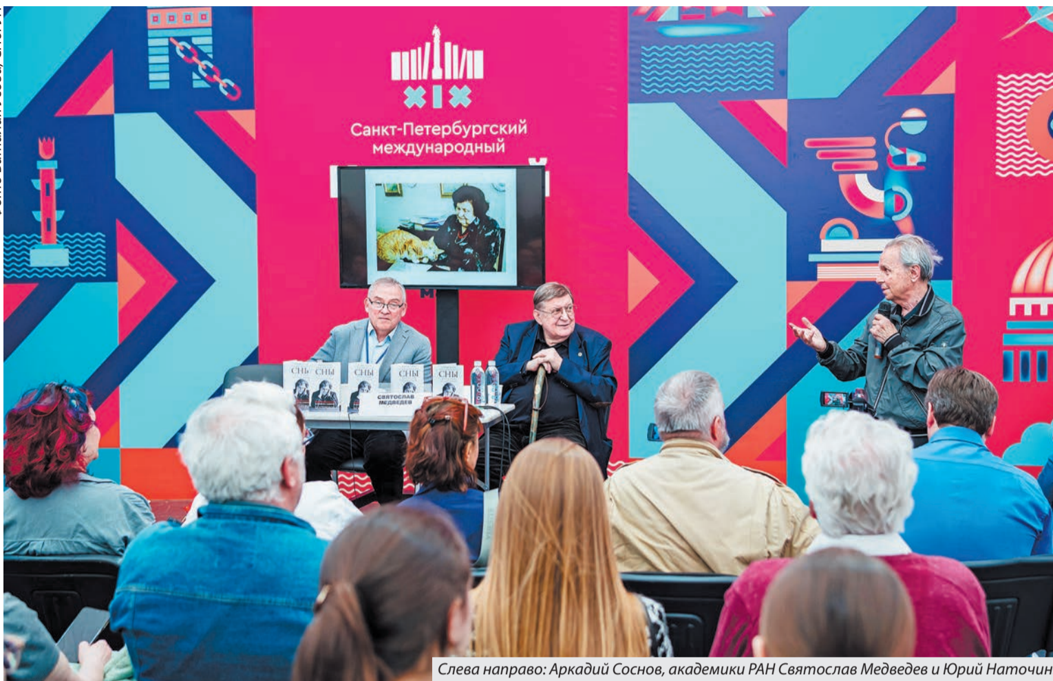
Слева направо: Аркадий Соснов, академики РАН Святослав Медведев и Юрий Наточин.